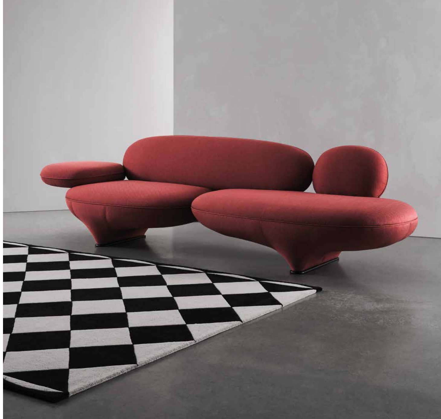
FIGURE Sofa FORME CHESS Rug