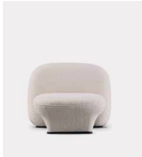
Item Nr. 27612