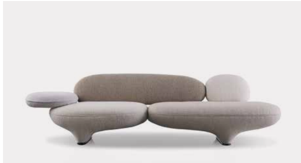
Item Nr. 27620