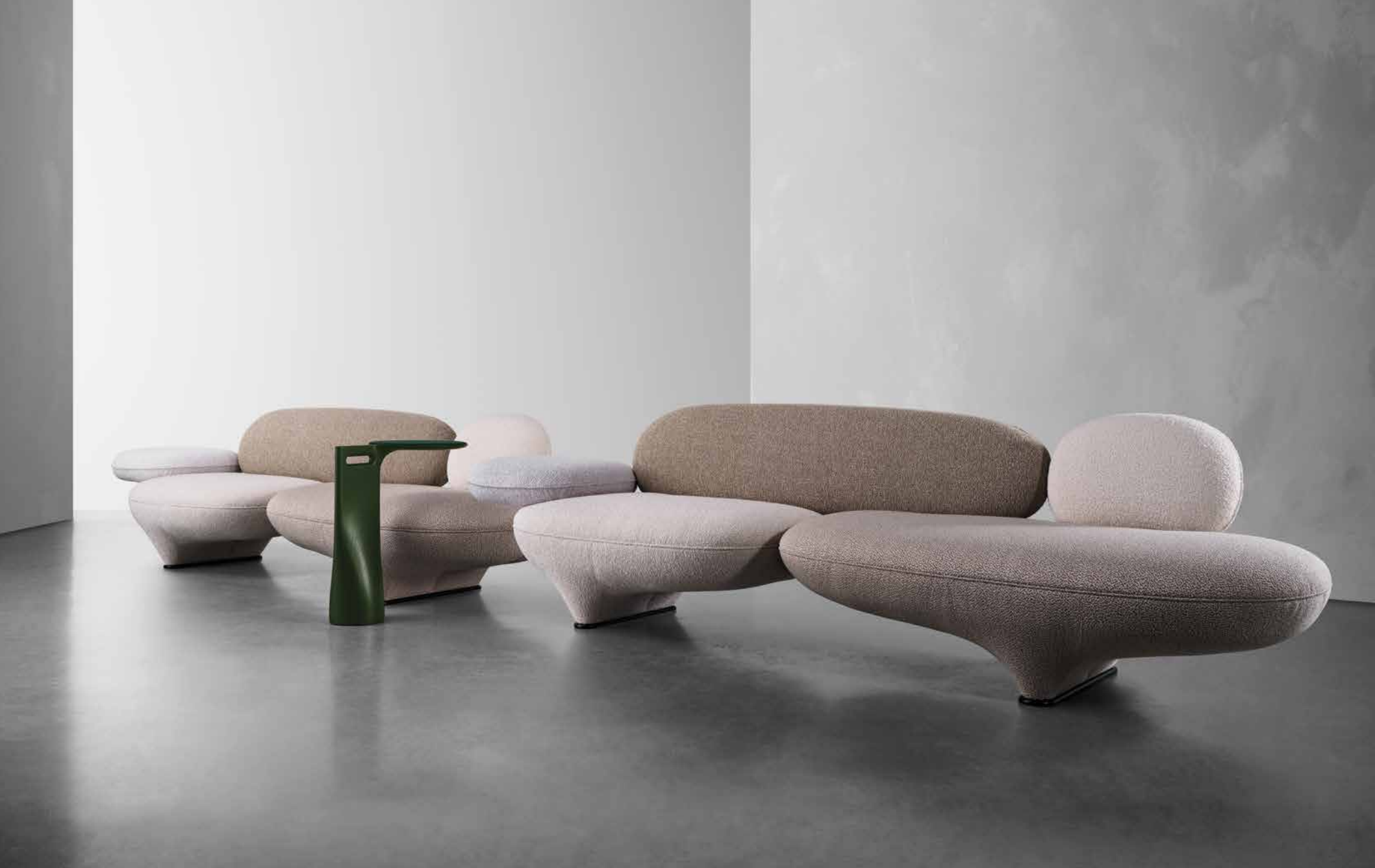
FIGURE Sofa TUKY Side Table