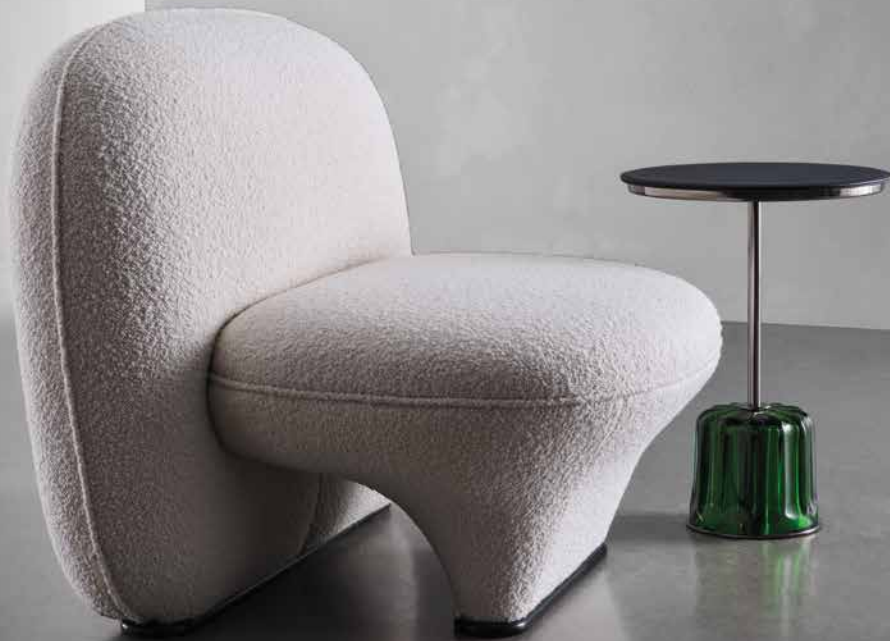
FIGURE Lounge Chair ACACIA Side Table

Kieselsteine, Schmucksteine oder ein Damenschuh? Die Formen der Serie FIGURE von Luca Nichetto regen die Fantasie an. FIGURE nimmt an der Natur ebenso Maß wie an außergewöhnlichen Schmuckstücken nach den Entwürfen von Josef Hoffmann und wird damit selbst zu einem ikonischen Objekt, das nicht nur spannend anzusehen, sondern auch überaus komfortabel und wohnlich ist. Ein Brückenschlag, der Wittmann aufs Neue spielerisch gelingt.