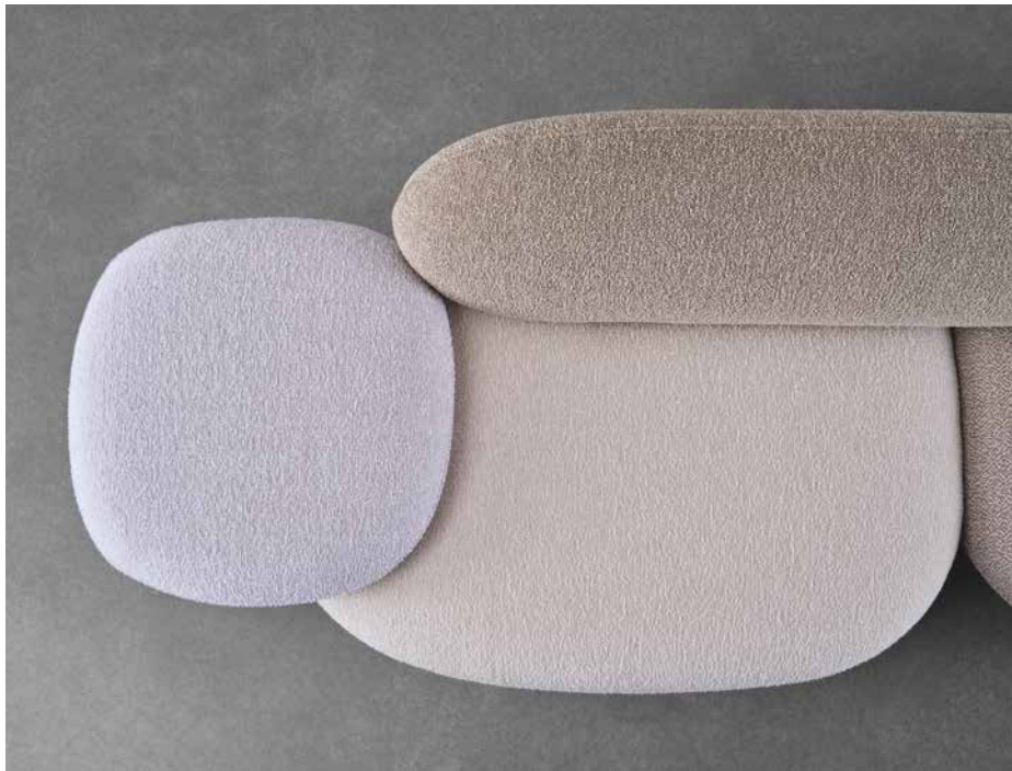
FIGURE Lounge Chair, Sofa

Die Idee der Schmucksteine in unterschiedlichen Farben findet bei der Wahl des Bezugsmaterials ihre Vollendung und kann individuell ausgelebt werden: Die Elemente können auf Wunsch in verschiedenen Farben bezogen werden und werden von einer präzise verlaufenden Keder im jeweiligen Bezugstoff umrahmt.