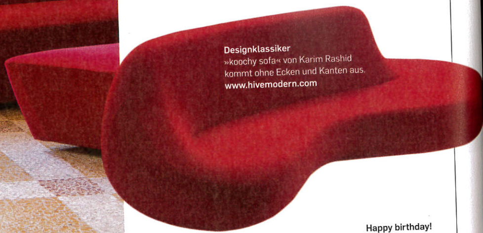
Designklassiker »koochy sofa« von Karim Rashid kommt ohne Ecken und Kanten aus. www.hivemodern.com

Interieur in hypnotischen Rot- Nuancen emotionalisiert den Winter und gibt den Ton an.