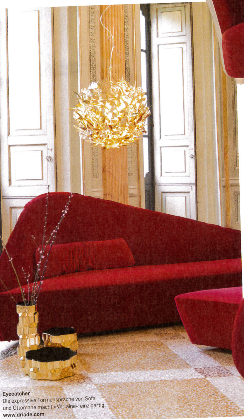
Eyecatcher Die expressive Formensprache von Sofa und Ottomane macht »Verlaine« einzigartig. www.driade.com