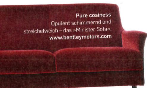
Pure cosiness Opulent schimmernd und streichelweich – das »Minister Sofa«. www.bentleymotors.com